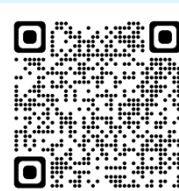
申込フォームQRコード

北海道教育大学へき地・小規模校教育研究センターホームページの 「へき地・小規模校教育推進フォーラム」のタブか、右のQRコードから 申込をお願いします。